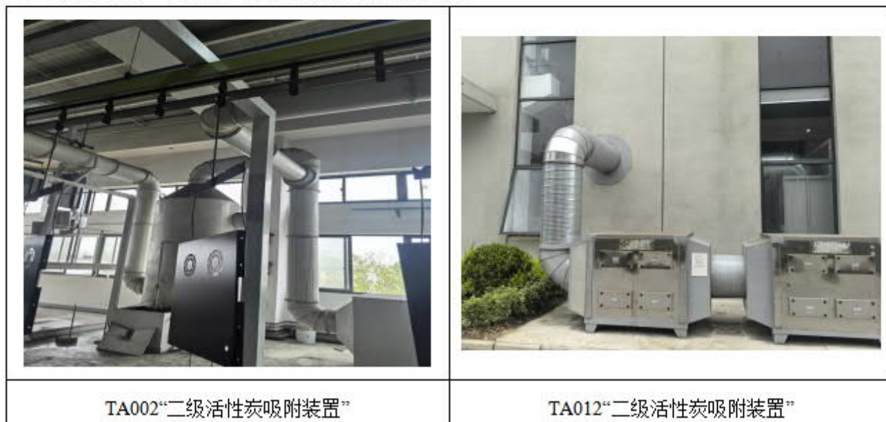
图 7-1 有机废气治理设施现场照片

依据现场治理设施情况，本项目两套有机废气治理设施的进口段不符合前 4 后 2 的采样口布置条件，治理设施的出口符合前 4 后 2 的采样口布置条件，故而本项目仅对治理设施的出口进行检测，有机废气治理设施现场照片如下：